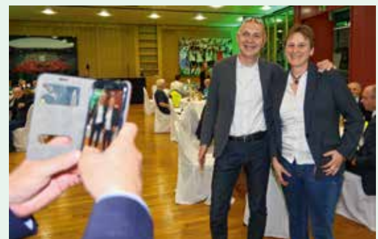
DFB-Präsident Bernd Neuendorf erfüllte die Fotowünsche der Preisträger.

Er wisse, dass die Fußball-Referees häufig in der Kritik stünden, sagt Neuendorf, dabei sei es eine Tätigkeit, „die mir zumindest immer viel Respekt abverlangt hat“. Sie benötige viel Kraft, aber auch Fingerspitzengefühl. „Vor allem möchte ich mich bei denen bedanken“, führt er aus, „die das nicht professionell betreiben.“ Wenn man aus einem kleinen Amateurverein komme wie er selbst, dann wisse man, was der Sport für den Verein, die Stadt und für die