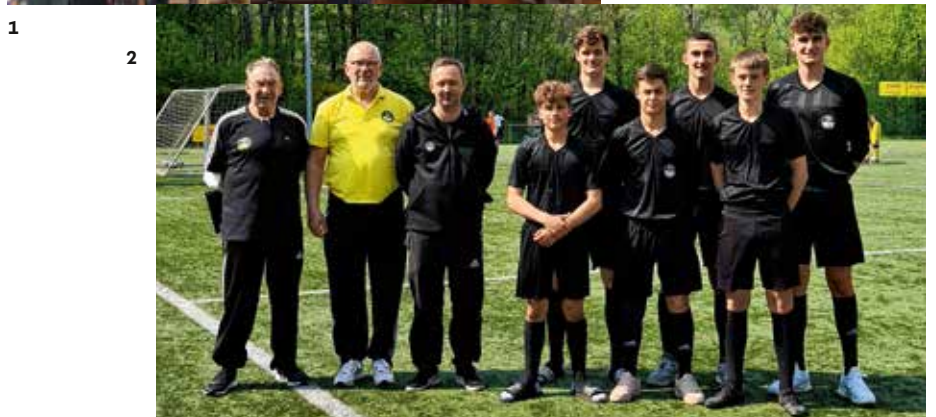
2_ Die Südwest-Talente mit ihren Coaches.