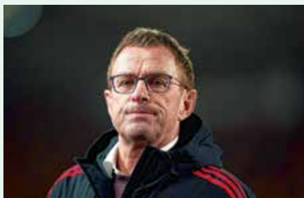
Ralf Rangnick brachte die Idee ins Spiel, Spieler und Schiedsrichter gemeinsam trainieren zu lassen.