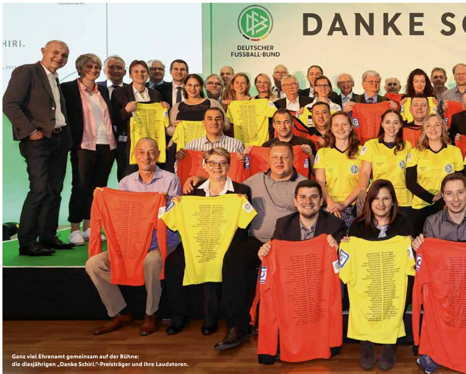
Ganz viel Ehrenamt gemeinsam auf der Bühne: die diesjährigen „Danke Schiri.“-Preisträger und ihre Laudatoren.