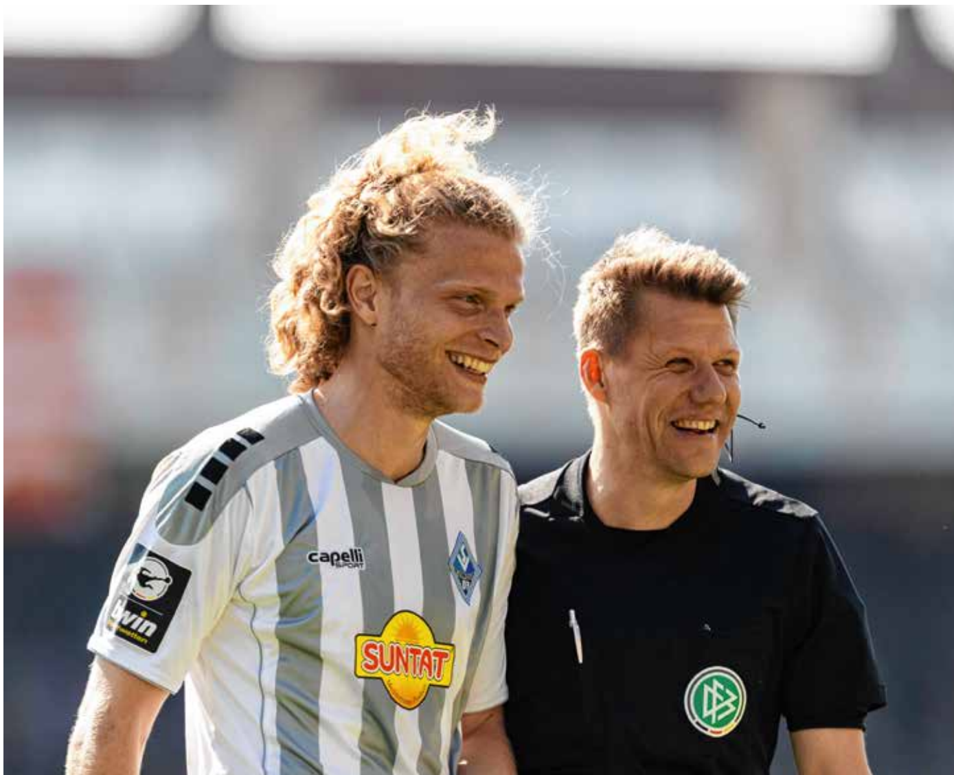
Lässt die Spielsituation einen entspannten Small Talk zu, kann dieser der Atmosphäre auf dem Platz förderlich sein.

Fall eine Gelb/Rote Karte. Der Schiedsrichter verliert in der Folge an Akzeptanz und damit an Spielkontrolle.