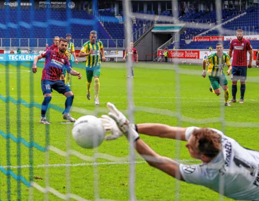
Beim Strafstoß muss der Schiedsrichter das Verhalten von Torwart, Schütze und den weiteren Mitspielern überwachen.