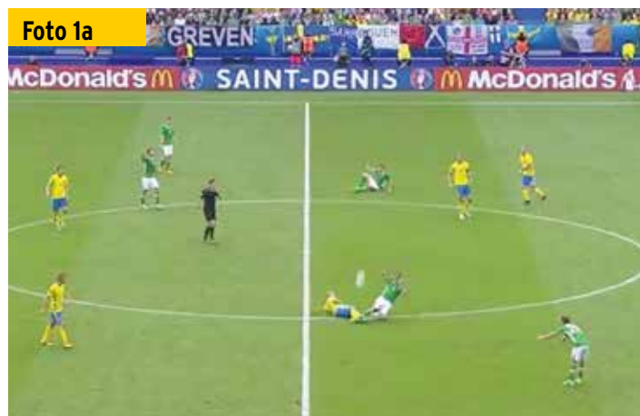
Foto 1a Noch während der gefoulte irische Spieler am Boden liegt (am Mittelfeld oben), setzt sein Mitspieler schon zur Gegenattacke an.