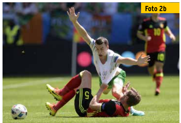
Als der Belgier schließlich am Boden liegt, reißt er seinen Gegenspieler nach unten.