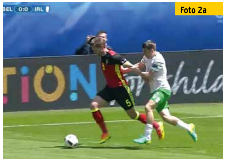
Während Jan Vertonghen (links) in Richtung eigener Hälfte unterwegs ist, wird er an Arm und Trikot festgehalten.

Wir schauen aber auf Kassai, der ebenfalls sofort zur Pfeife greift. Auf Foto 3a ist zudem erkennbar,