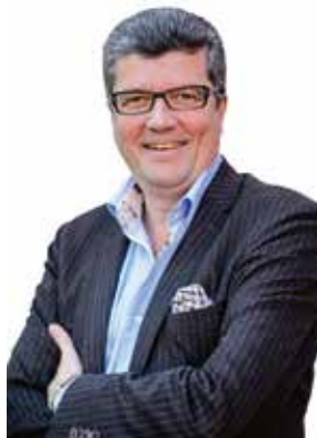
Herbert Fandel, Vorsitzender des DFB-Schiedsrichter-Ausschusses

Wichtig für einen Turnier-Schiedsrichter ist deshalb in erster Linie eine breite Akzeptanz seiner Spielführung. Diese bekommt man von den Spielern nicht geschenkt, sie ist das Ergebnis harter Arbeit und meist auf jahrelange gute und berechenbare Leistungen eines Unparteiischen im internationalen Fußball zurückzuführen.