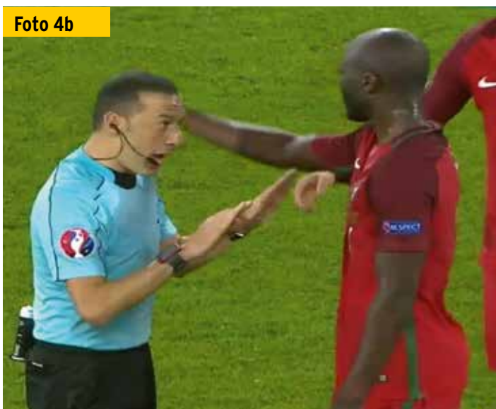
Schiedsrichter Cakir lässt sich von der Unsportlichkeit provozieren und hat Mühe, selbst die Ruhe zu bewahren.

Durch dieses konsequente Auftreten, durch die Klarheit und Schnelligkeit in seinem Handeln, vermittelt die Körpersprache von Viktor Kassai: Dieser Unparteiische weiß genau, was er hier gerade macht.