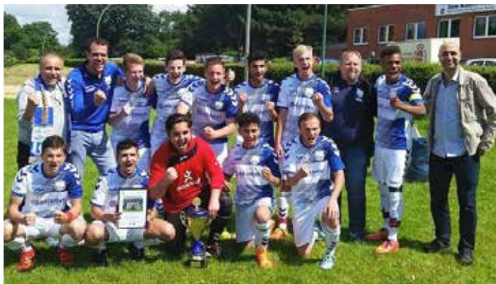
Sieger des Jung-Schiedsrichter-Masters des Fußballverbandes Niederrhein wurde in diesem Jahr die Mannschaft des Kreises Duisburg/Mülheim/Dinslaken.