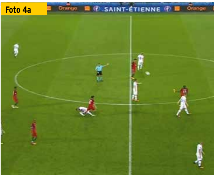
Nach dem Pfiff des Schiedsrichters kickt der Portugiese (rotes Trikot, rechts) den Ball in Richtung des Unparteiischen.