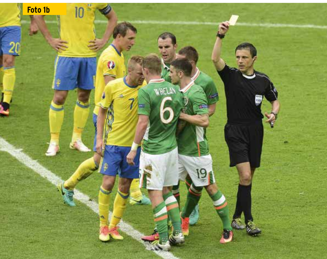
Foto 1b Die Körpersprache von Schiedsrichter Milorad Mazic wirkt bei der Aussprache der Verwarnung alles andere als souverän.

Als Mazic nun auf den Ort des zweiten Vergehens zugeht, scheint er gedanklich noch beim ersten Vergehen zu sein. Er wirkt