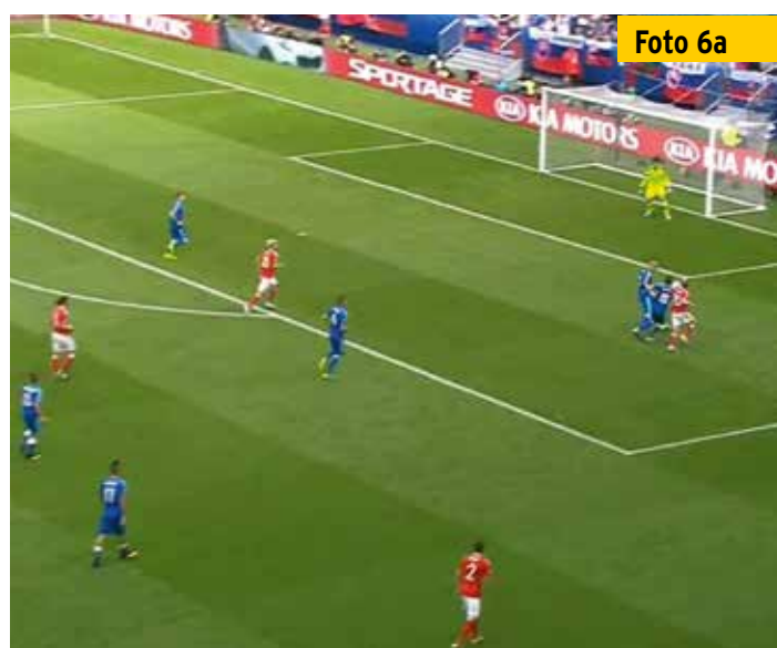
Wäre der Schiedsrichter näher an den Zweikampf im Strafraum herangelaufen,...