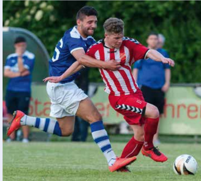
Verhindert der Verteidiger durch eine gegnerorientierte Spielweise eine eindeutige Torchance, gibt es in jedem Fall einen Platzverweis.

Direkter Freistoß und Verwarnung. Der Freistoß wird an dem Punkt der Außenlinie ausgeführt, die dem Vergehen am nächsten liegt, weil beide Spieler zuvor im Zuge