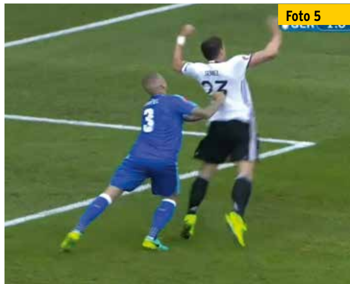
Plumper geht es kaum: Der Slowake Skrtel stößt dem deutschen Stürmer im eigenen Strafraum beide Hände in den Rücken.

Nur wer als Schiedsrichter gut steht, kann ein Vergehen klar wahrnehmen. Und nur wer ein Vergehen klar wahrnimmt, kann eine klare Entscheidung treffen und diese mit einer klaren Körpersprache kommunizieren.