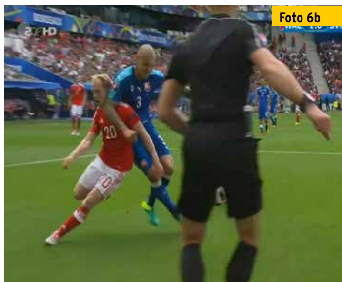
...hätte er vielleicht eine Chance gehabt, den Stoß des slowakischen Verteidigers (blaues Trikot) zu erkennen.