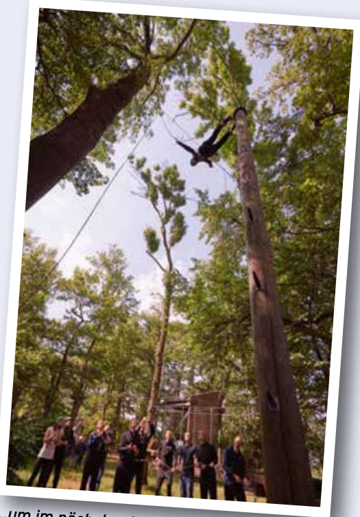
...um im nächsten Moment im freien Fall von einem Pfahl herunterzuspringen.