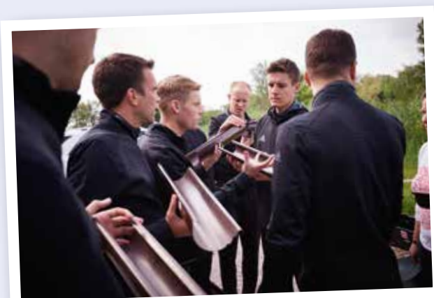
Aus diesen Bauteilen entsteht am Ende eine möglichst lange Rinne, durch die ein Golfball rollt.