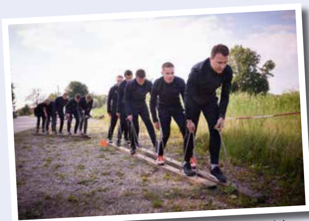
Bei dieser ungewohnten Form des Staffel-Laufs ist gute Koordination erforderlich.