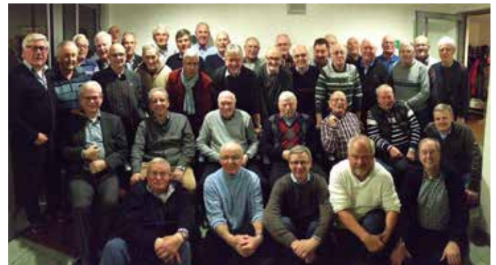
Strahlende Gesichter beim zwölften Treffen der Bremer „Ehren-Schiedsrichter“.