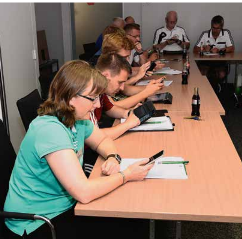
Probieren geht über studieren: Die Lehrwarte entdeckten neue Möglichkeiten ihrer Smartphones und Tablets.

Eine weitere wichtige Funktion der Weiterbildung in Kaiserau sahen die Lehrwarte im informellen Austausch über die Landesverbandsgrenzen hinweg: „Wir verfolgen alle das gleiche Ziel, alle Teilnehmer haben