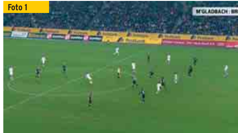
Beim Zuspiel von Nordtveit stehen die beiden Gladbacher Stürmer (weiße Trikots) im Zentrum noch nicht im Abseits.