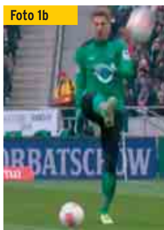
Er schießt den Spielball aus dem Feld.

Wer bei der Video-Analyse dieser Szene genau hinhört, bemerkt, dass der nun folgende Pfiff des Schiedsrichters mit einer ganz kleinen Verzögerung kommt. Fachleute erkennen daran, dass er eine Sekunde -