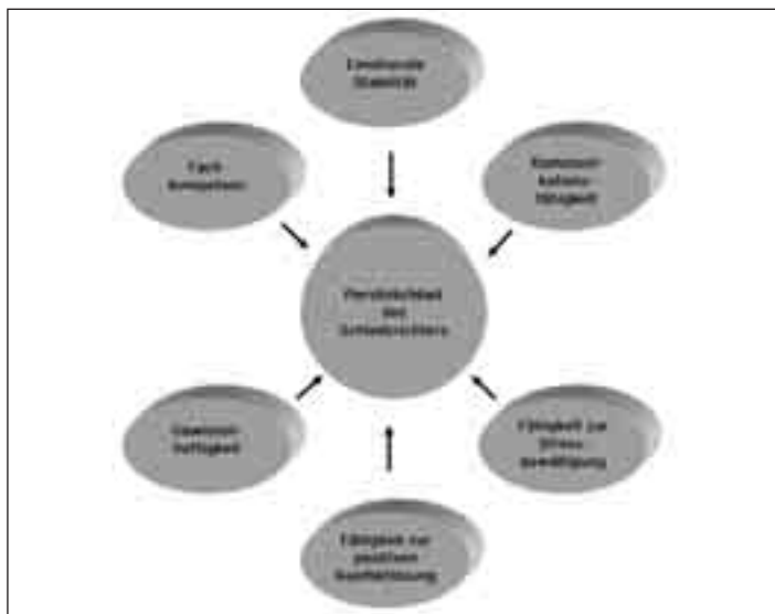
Die Grafik aus dem DFB-Lehrbrief Nr. 35 stellt die Kompetenzen dar, die man als Schiedsrichter entwickelt.

soll ihnen nach ihrer Haftentlassung die Integration ten vor.