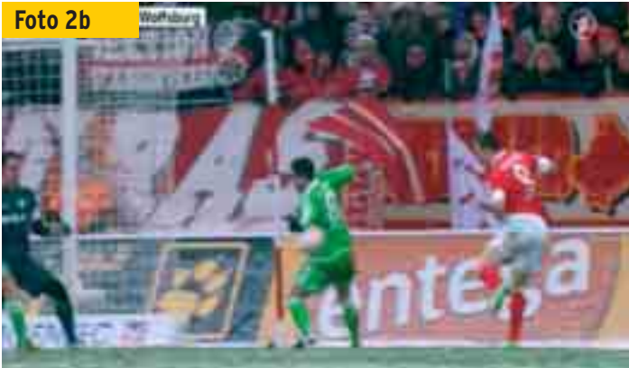
...der dem Wolfsburger Vierinha gegen den linken Arm fliegt.