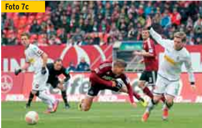
...und legt einen gekonnten Sturzflug hin (samt Schmerzensschrei).