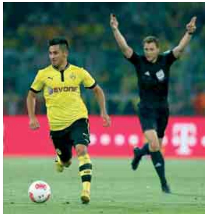
Mit nach vorne gestreckten Armen zeigt Schiedsrichter Felix Zwayer an, dass er ein Foul erkannt, aber auf „Vorteil“ entschieden hat.

Darüber hinaus spielt nach Ansicht des IFAB der Spielcharakter eine bedeutende Rolle bei der Anwendung von Vorteil. In einem überhart geführten, zerfahrenen Spiel mit zahlreichen offenen und versteckten Fouls muss der Unparteiische deutlich kleinlicher pfeifen