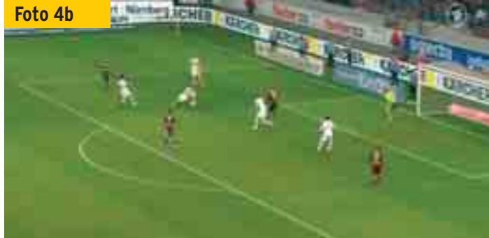
Von der Tribüne aus gesehen: Kvist stoppt den Ball mit der linken Hand.