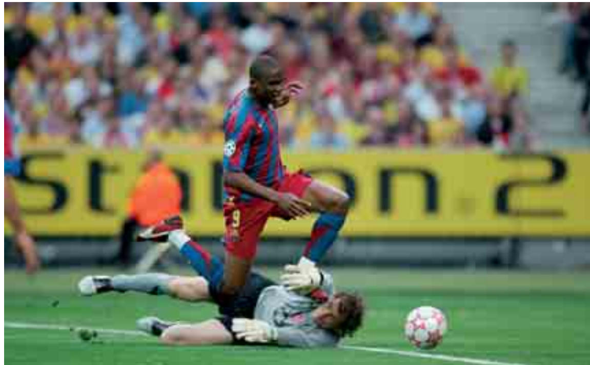
Als Jens Lehmann im Finale der Champions League 2006 Samuel Eto'o von den Beinen holt,...

Von regeltechnischer Bedeutung für die Bewertung eines Vergehens und die daraus erwachsende Konsequenz ist für den Schiedsrichter, dass er immer dann das ursprüngliche Vergehen zu bestrafen hat, wenn der Vorteil nicht direkt nach dem Foul eintritt. Die