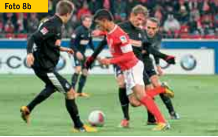
...prallt aber (mit Absicht?) gegen den Oberschenkel seines Gegners.