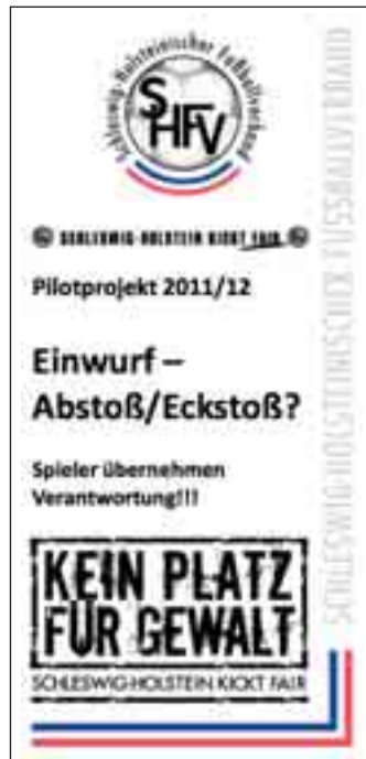
Der Flyer einer Aktion in Schleswig-Holstein, bei der die Spieler selbst über Einwürfe sowie Ab- und Eckstöße entscheiden sollen.