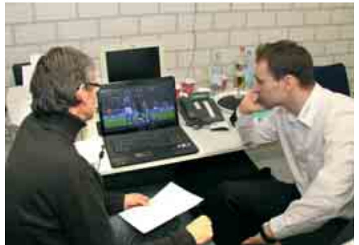
Die Fernsehbilder lassen manchen Zweikampf aus einem anderen Blickwinkel und damit in einem anderen Licht erscheinen.

18.45 Uhr: Als die relevanten Spielszenen besprochen sind, verlässt das Team die Kabine und geht