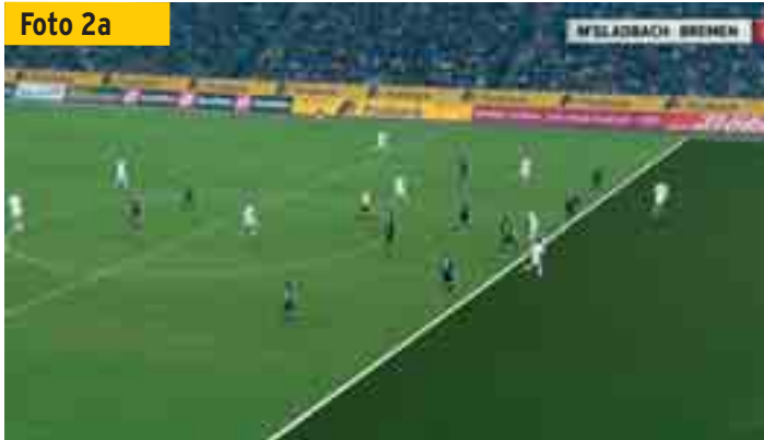
Als Younes den Ball mit der Hacke verlängert, sieht Assistent Jan-Hendrik Salver die Abseits-Position von Patrick Herrmann,...