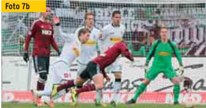
Der Nürnberger fädelt mit links hinter dem Bein des Gladbacher ein...