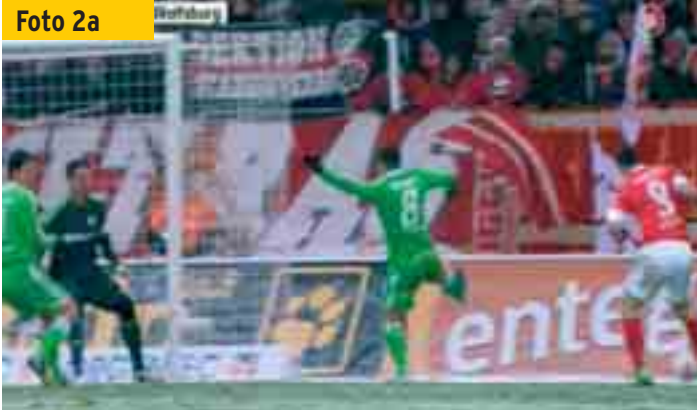
Der Mainzer Pospesch (rechts am Bildrand) spielt den Ball zur Mitte,...