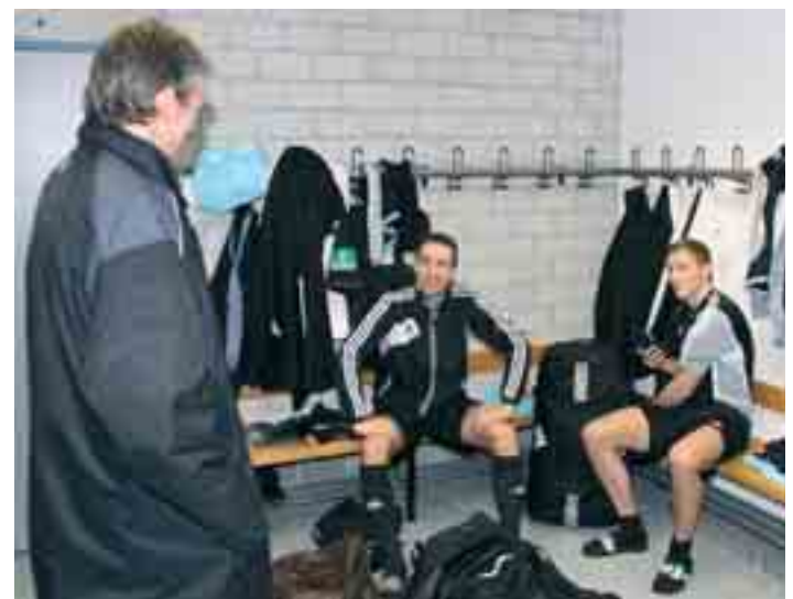
In der Kabine kann es auch mal locker zugehen...