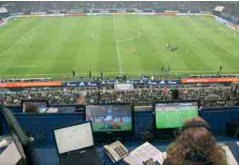
Während einer Verletzungsunterbrechung sieht der Schiedsrichter-Beobachter auf den TV-Monitoren die Wiederholung des vorangegangenen Zweikampfs.

eine Rolle spielten, diskutieren wir heute über Entscheidungen, bei denen sich einzelne Körperteile im Abseits befinden oder auch nicht.“