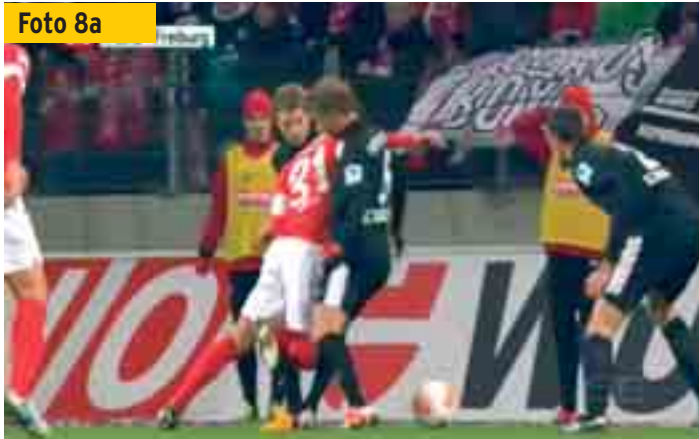
Der Mainzer Parker will sich durch die Lücke spielen,...

derung, der mit dem Begriff „Absicht“ zu tun hat. Das Thema „Simulation“ beschäftigte die Schiedsrichter in der Rückrunde bisher stärker als es in der Vergangenheit der Fall war.