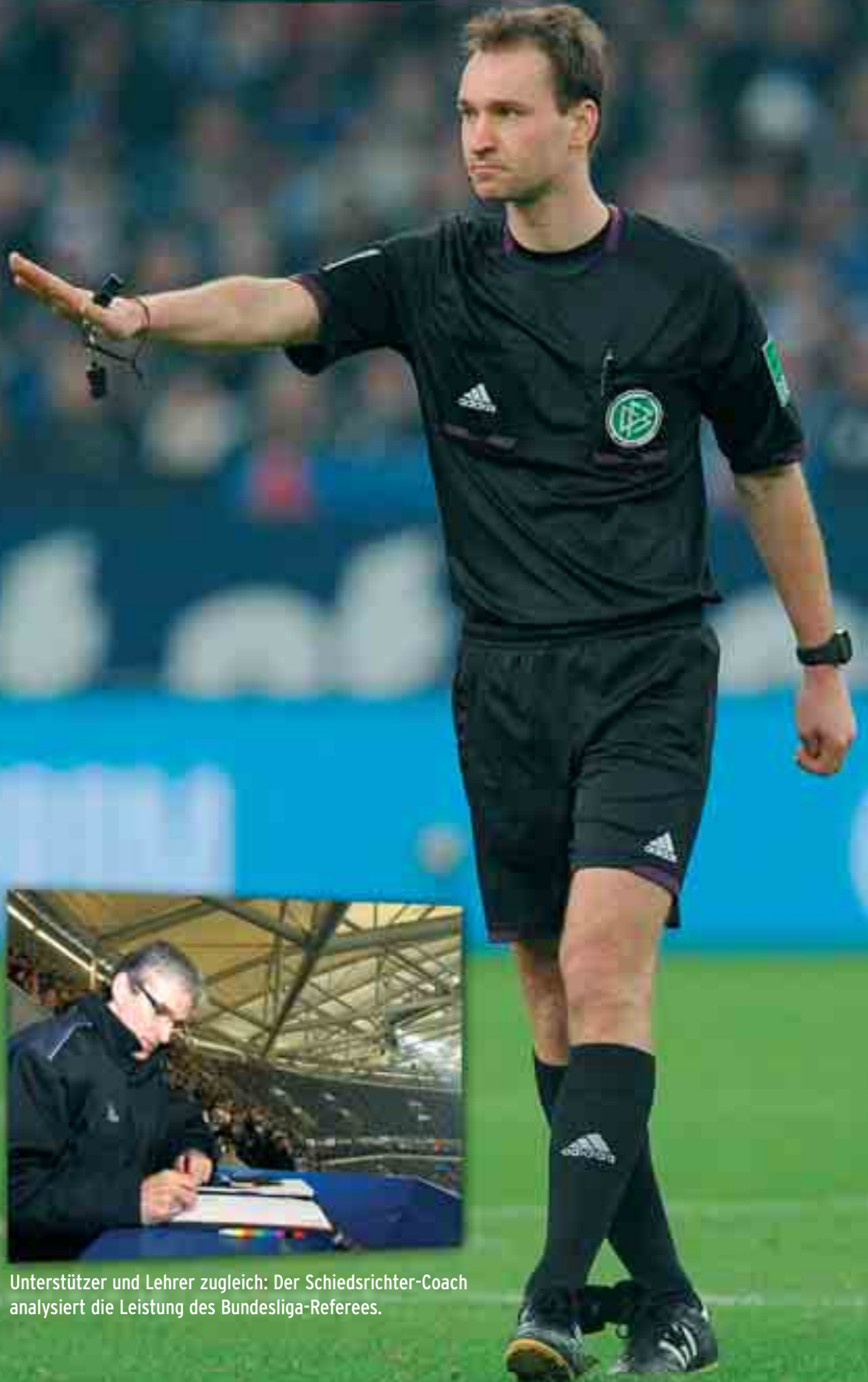
Unterstützer und Lehrer zugleich: Der Schiedsrichter-Coach analysiert die Leistung des Bundesliga-Referees.

Perspektive: Schiedsrichter- Ausbildung in der Haftanstalt