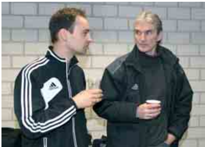
...aber die ernsthafte Einstimmung auf das Spiel bestimmt weitgehend die Vorbereitung.