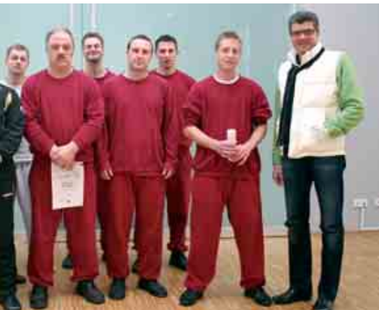
mit ihren Betreuern und Herbert Fandel (rechts). Der Vorsitzende ist Pate des Projekts.

Obwohl die Häftlinge in Wittlich ihre Prüfung gerade erfolgreich abgeschlossen haben, fängt für sie die „Herausforderung Schiedsrichter“