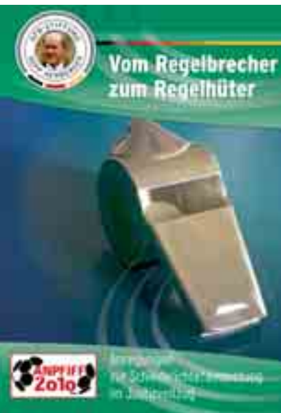
In der Broschüre der Sepp-Herberger-Stiftung werden Hinweise zur Durchführung einer Schiedsrichter-Ausbildung in Haftanstalten gegeben.

auf dem Platz passiert“, sagt Fandel zu den Teilnehmern des Lehrgangs.