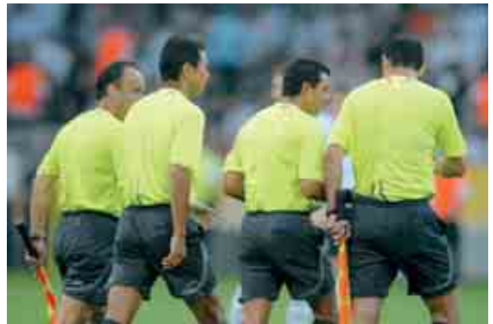
Wohl dem, der mehr Schiedsrichter hat als er muss.

größten „Batzen“ strich Amisia Rheine mit 250 Euro ein, gefolgt vom SV Burgsteinfurt und dem Skiclub Rheine (je 100 Euro). SV Wilmsberg, Lau-Brechte und Eintracht Rheine erhielten je 50 Euro.