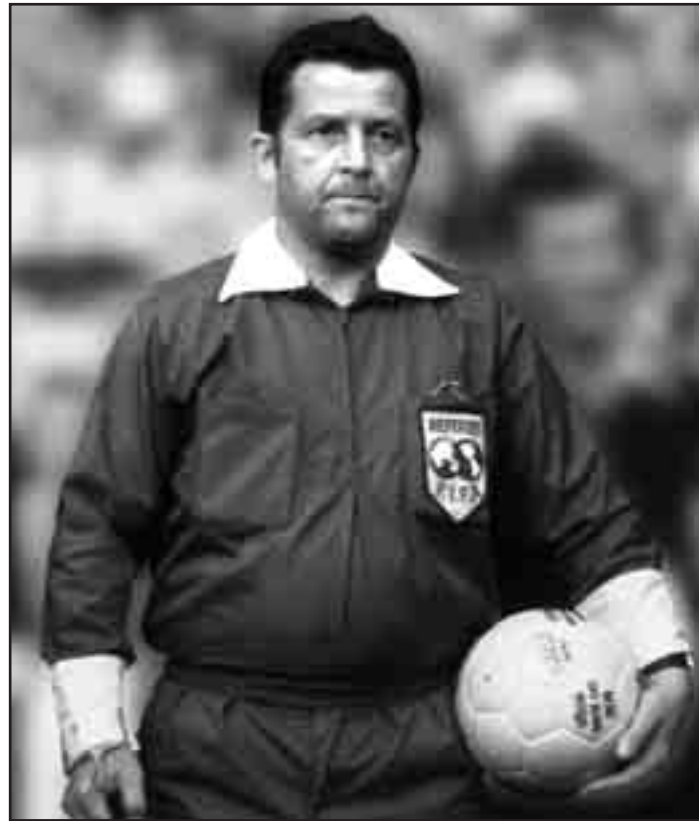
Gerhard Schulenburg (1926 bis 2013).

Die Liste der hochkarätigen Fußballspiele, die „Schule“ geleitet hat, ist lang. Zum Beispiel piffte er am 15. April 1967 den legendären 3:2-Auswärts-Sieg der Schotten im Wembley-Stadion gegen den damaligen Weltmeister vor 100.000