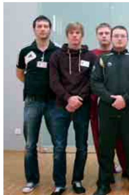
Ein Teil der ausgebildeten Häftlinge der DFB-Schiedsrichter-Kommission

Unter diesem Titel hat die Sepp-Herberger-Stiftung eine Broschüre