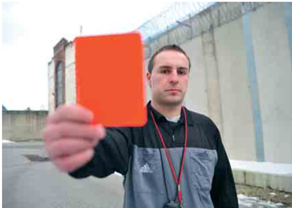
Schiedsrichter-Sein als Perspektive: Häftlinge der JVA Wittlich haben erfolgreich an einem Anwärter-Lehrgang teilgenommen.

Als die Häftlinge der JVA Wittlich die Urkunden für die bestandene Schiedsrichter-Prüfung erhalten, ist auch Herbert Fandel mit dabei. Der Vorsitzende der DFB-Schiedsrichter-Kommission ist Pate der Aktion und blickt dabei zum ersten Mal hinter die hohen Mauern der Wittlicher Anstalt. „Oft genug im Leben sagen andere Menschen einem, was man tun muss. Viel interessanter ist es, wenn ihr künftig als Schiedsrichter selbst entscheiden dürft, was