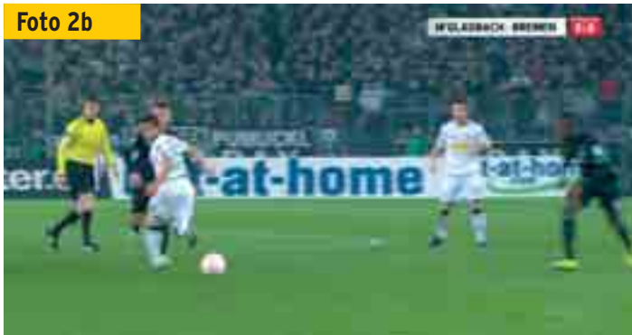
...und Schiedsrichter Wolfgang Stark erkennt von seiner Position die Richtungsveränderung des Balles.

Ball befindet und nur einen Gegenspieler (den Torwart) vor sich hat, steht er im Abseits. Weil der Ball auch tatsächlich zu ihm gelangt und er ins Spiel eingreift, handelt es sich um eine strafbare Abseits-Stellung (Foto 2a).